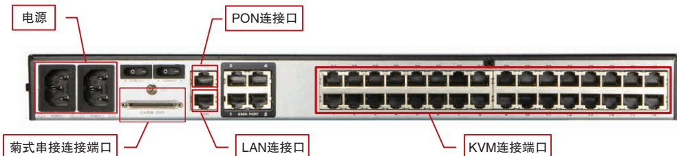
· KM0532 后视图