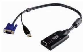
USB电脑端模块 KA7170 x 200