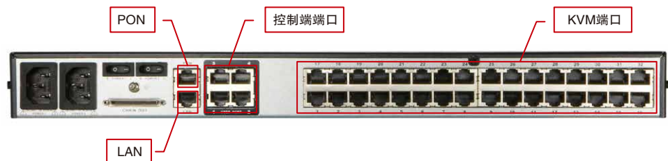
• KM0532 后视图