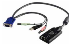
USB电脑端模块 KA7176 x 16