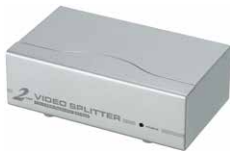
2端口视频分配器 VS92A x 4