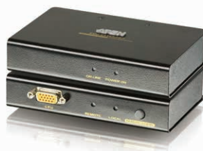
PS/2 KVM信号延长器 CE250A x 2