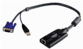
USB电脑端模块 KA7170 x 64