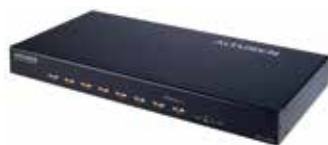
8端口Serial Console Server 串口控制台服务器 SN0108 x 2