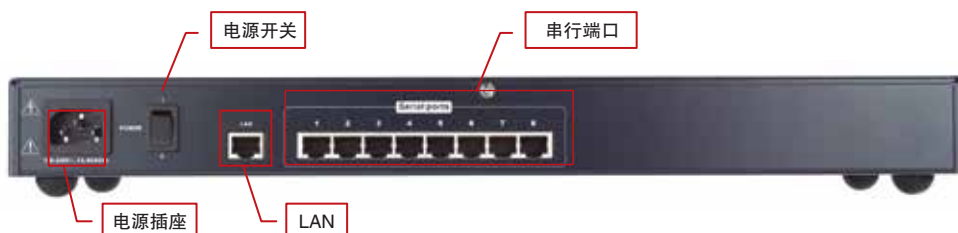
• SN0108 后视图