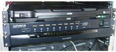
KN2116A、PN0108,及 CL5800 運作順暢，且皆僅占用 1U 機 架空間

柚子電視在導入 ATEN 解決方案後，所有的作業都能在此高效率架構下順利完成。柚子電視將電腦連接至 KN2116A KVM 多電腦切換器，以透過網路進行 BIOS 層級的電腦管理，並將電腦的電源連接至 PN0108，當電源開啟時其會自動啟動。透過 Over the NET™ 遠端管理功能，機房管理人員及維修人員可從任何地點管理電腦。KN2116A 與 PN0108 介面能相互整合，並透過網路控管電腦的電源，使用者只要點選在 KN2116A 介面上所需電腦的電源圖示，就如同使用者親自按下主機上的按鈕。由於管理人員大多可從自己的坐位上執行作業，能有效降低頻繁進出機房的時間成本耗損，此舉不但建置了一個穩定服務的作業環境，也解決了人手不足的問題。