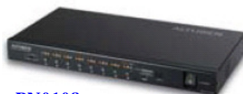
PN0108 8 埠遠端電源管理方案