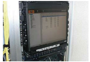
CL5800 螢幕/鍵盤/觸控板可獨立抽拉，節省機櫃空間

未來 ATEN 將持續協助柚子電視強化遠端管理功能，進而為柚子電視的客戶提供更多元的優質服務。