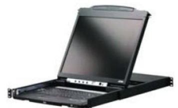
CL5800 雙滑軌 LCD PS/2-USB 控制端