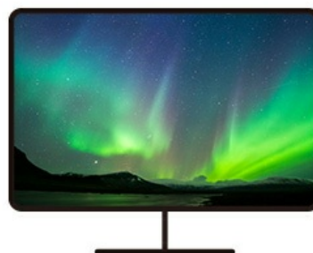
常に最適化された動画