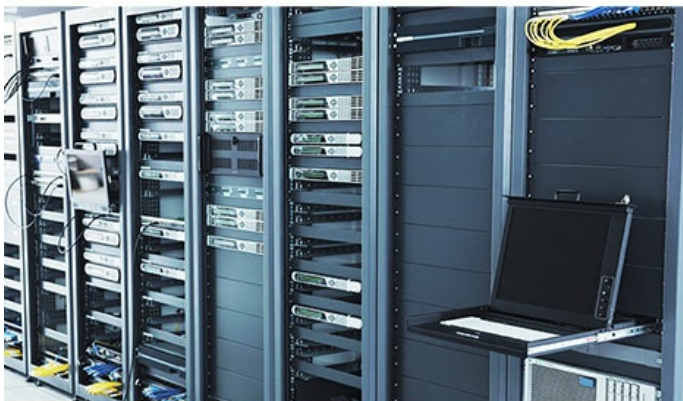
Network Service Provider