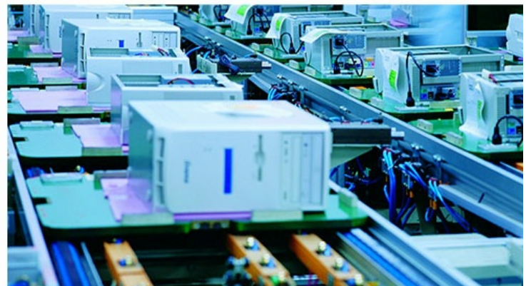
Production Line or Lab