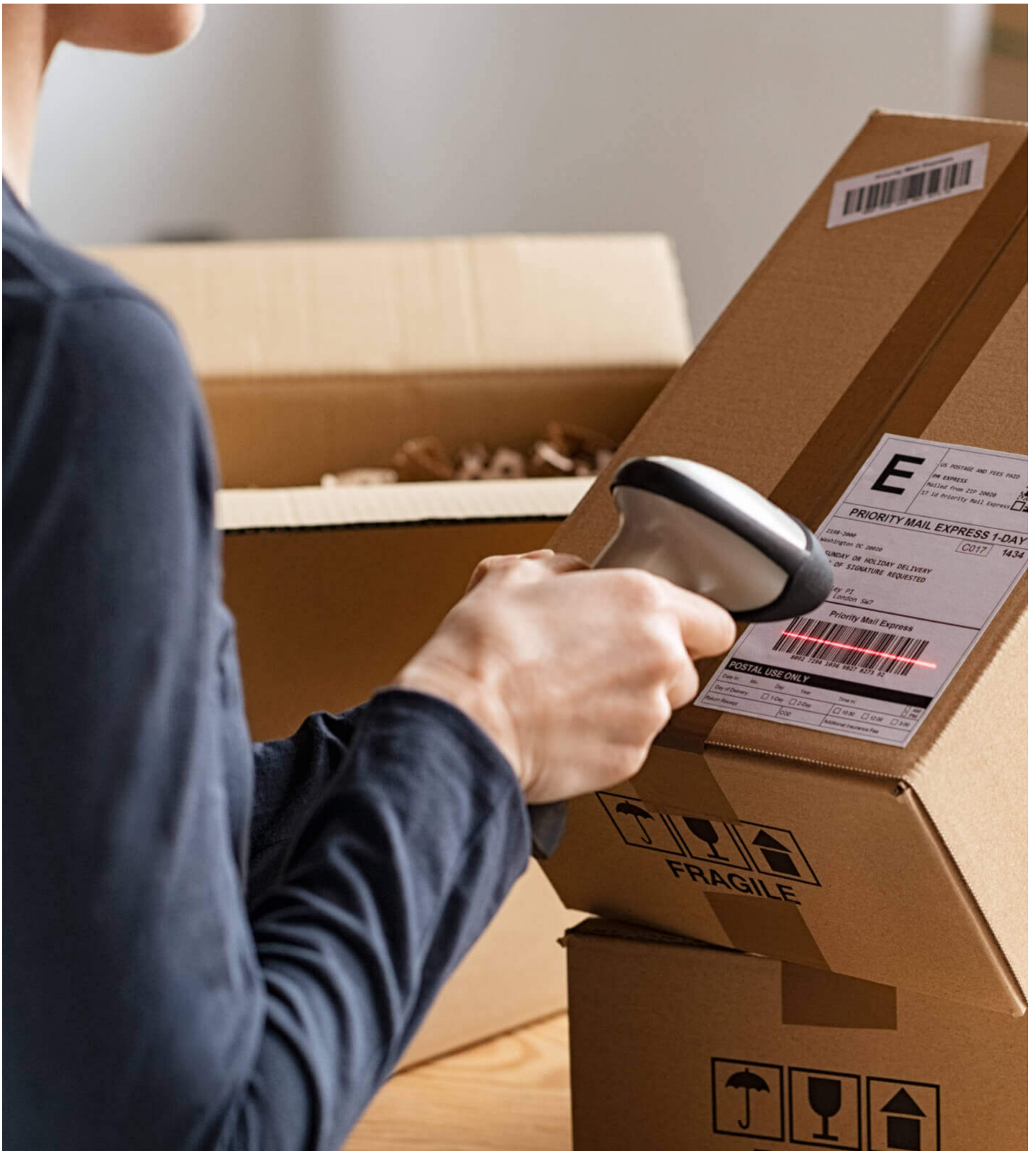
バーコードスキャナー