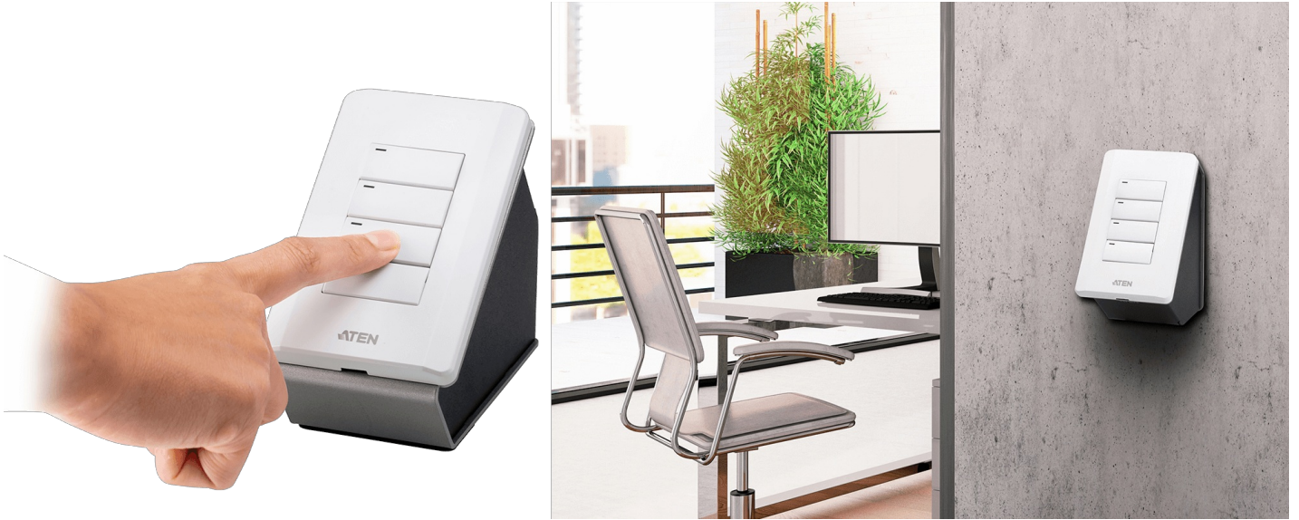
유연한 설치가 가능하여 테이블 위에 놓거나 벽에 장착할 수 있습니다.