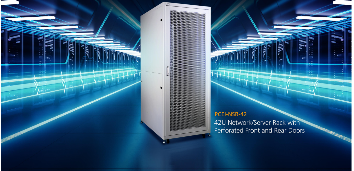
PCEI-NSR-42 42U Network/Server Rack with Perforated Front and Rear Doors

Reconocidos por su solidez y fiabilidad, los racks de ATEN cuentan con diversas certificaciones que avalan su fiabilidad a la hora de proteger equipos informáticos críticos en centros de datos y salas de servidores. Además de las certificaciones UL y CE, los racks de ATEN también cumplen con la norma EIA/ECA-310-E.