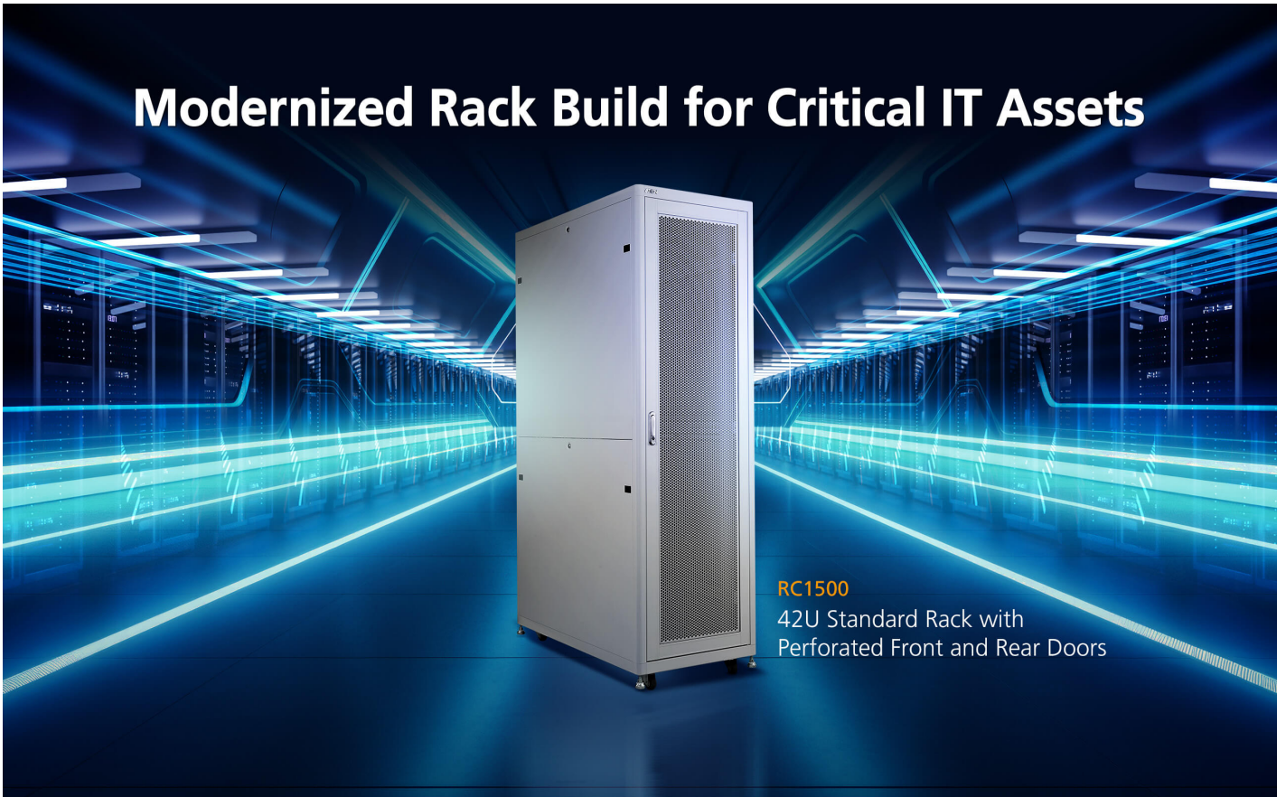
RC1500 42U Standard Rack with Perforated Front and Rear Doors

Reconocidos por su solidez y fiabilidad, los racks de ATEN cuentan con diversas certificaciones que avalan su fiabilidad a la hora de proteger equipos informáticos críticos en centros de datos y salas de servidores. Además de las certificaciones UL y CE, los racks de ATEN también cumplen con la norma EIA/ECA-310-E.