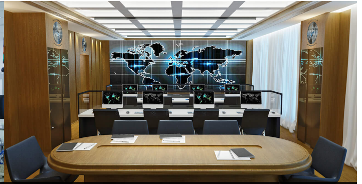
Meeting Room Control Center