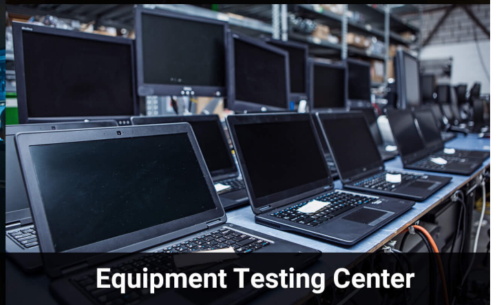
Equipment Testing Center