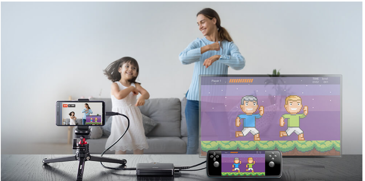
Captura de juegos incluso para juegos para fiestas