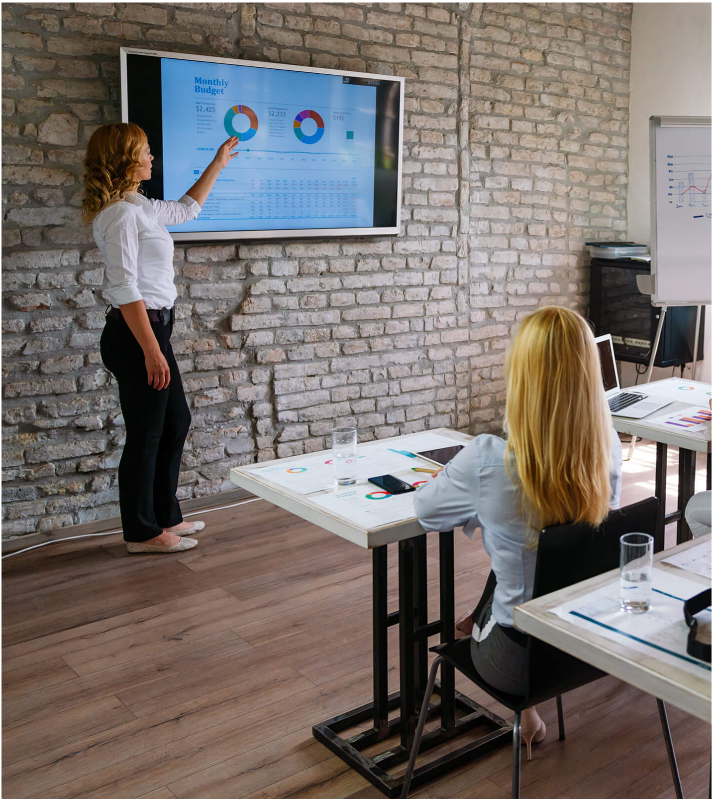
Sala de aula