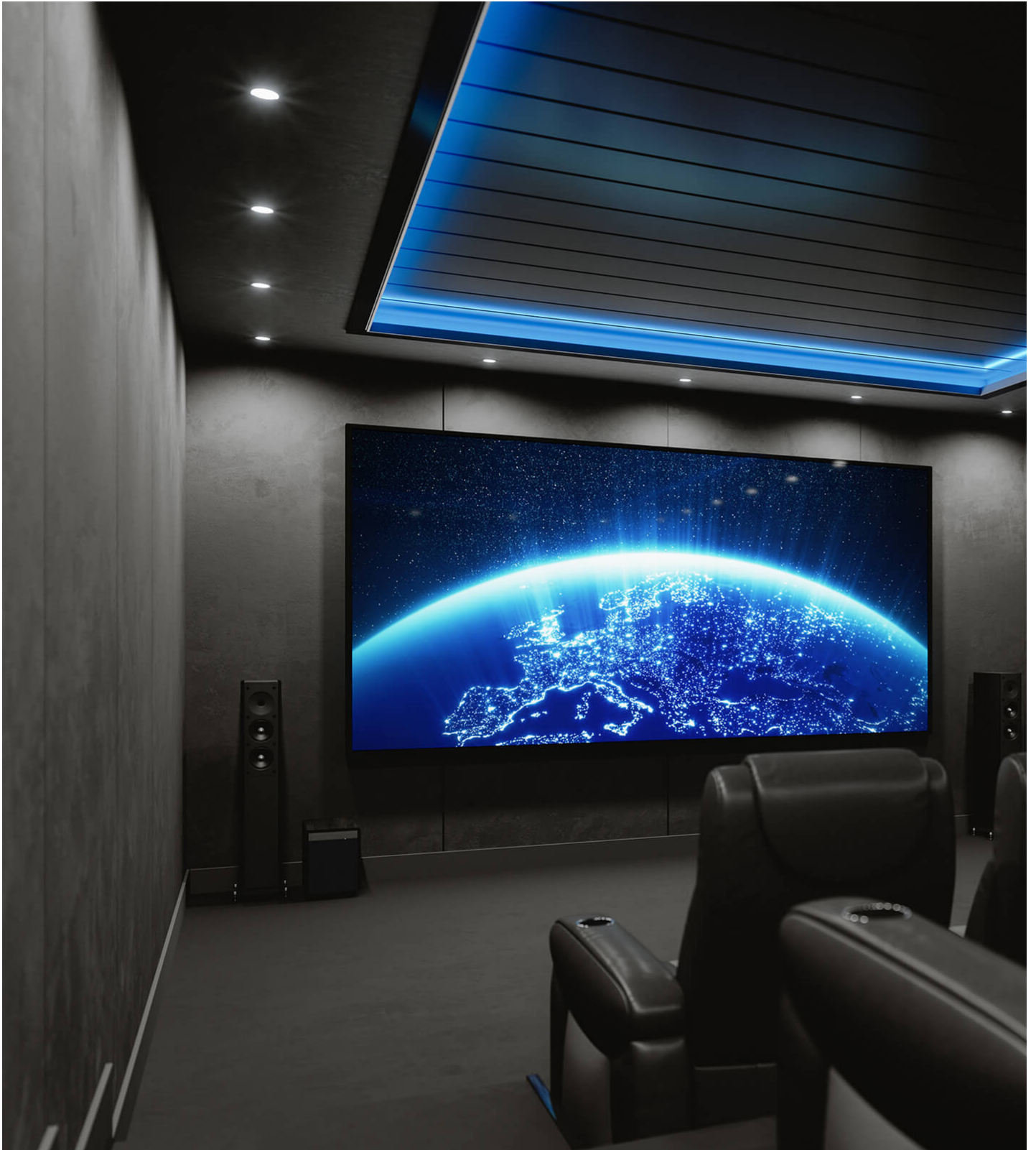
Cinema em casa