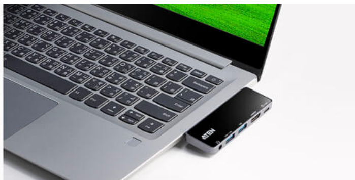
Computador portátil Windows