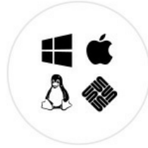
支援多平台 Windows、Mac Linux、Sun