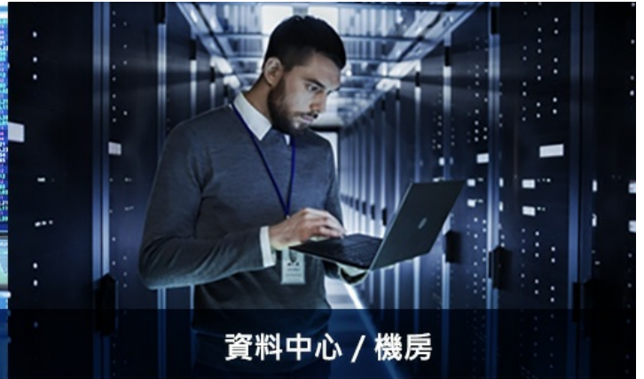
資料中心 / 機房