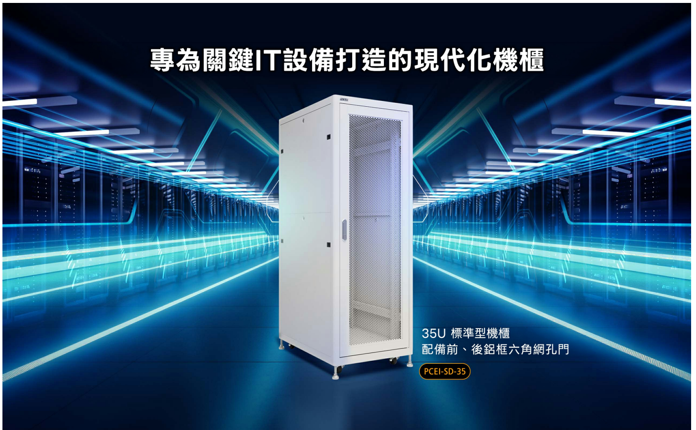
35U 標準型機櫃 配備前、後鋁框六角網孔門